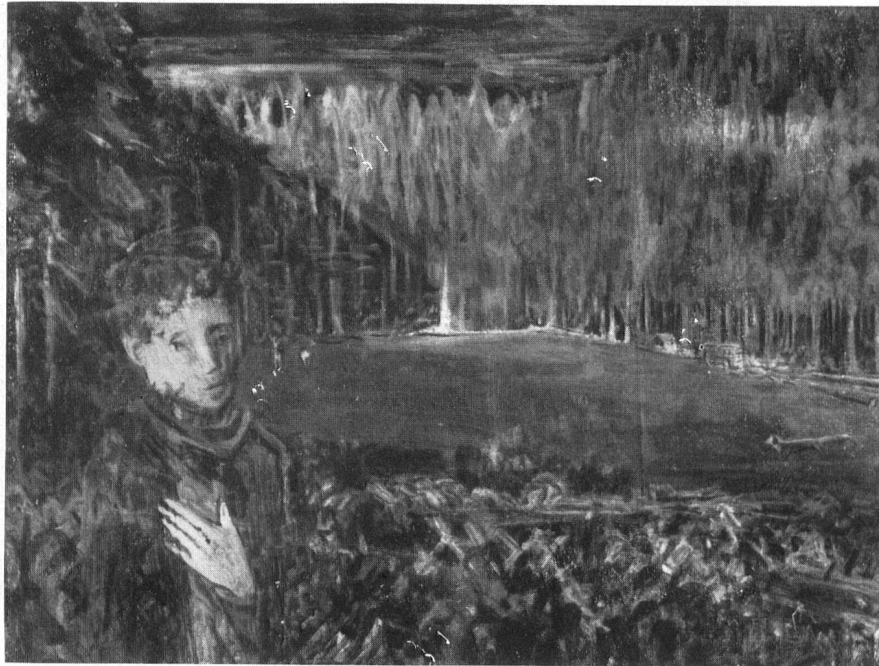
A. H. Pellegrini (Basel), Träumerei

nerem Rahmen durchführten, wäre dies möglich. Die großen, ermüdenden gesamt-schweizerischen Ausstellungen müßten fallengelassen werden. Statt alle 3 Jahre würde ich vorschlagen, alle 2 Jahre kleinere, regionale Ausstellungen zu veranstalten, so daß 2 bis 3 Sektionen, bei kleineren Sektionen 4 bis 5, diese jeweils beschicken könnten. Dann wäre es wahrscheinlich auch möglich, mit 5 Bildern einzuladen. Die Veranstaltungen könnten dann auch in Städten mit kleineren Ausstellungsräumen durchgeführt werden.