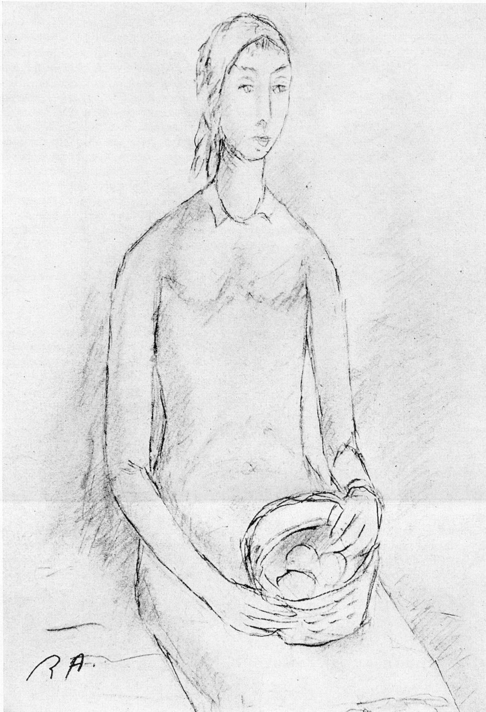
La jeune femme et le panier de pommes (dessin)

jonois a su interdire inexorablement aux importuns de tout genre, les glaçant au besoin de son regard bleu-gris, de ce «cristal électrique» qui, selon Charles-Albert Cingria dans son étonnant portrait du peintre, «faisait salutairement trembler les faquins et les fats». Et qui eût pu ne pas courir le risque de faire, un jour ou l'autre, figure d'importun aux yeux d'un homme «fou de dessin» à l'égal d'Hokusai et dont la rigoureuse discipline de travail était le pendant très exact de celle de son ami Ramuz?