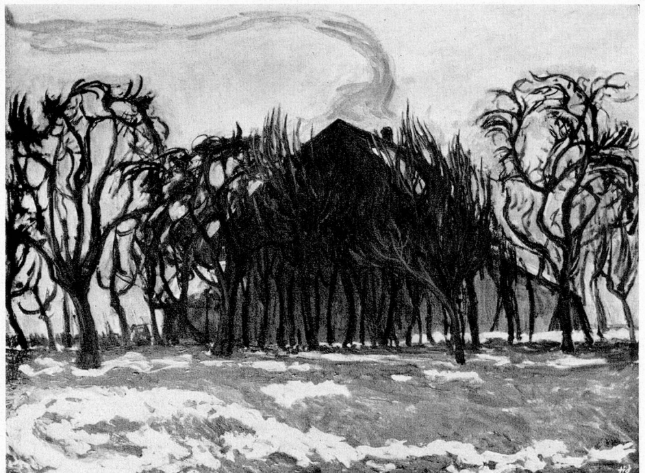
Hans Jauslin: Haus am Abend

An der diesjährigen Generalversammlung unserer Sektion, die wir in aller Stille auf der idyllischen St.-Peters-Insel durchführten, wurde uns so sehr bewußt, wie unser