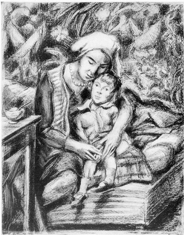
Charles Clément 1932