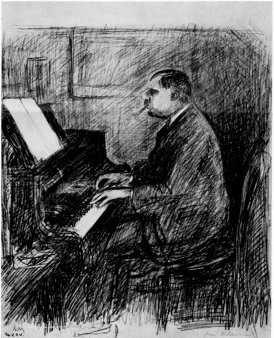
E. Morgenthaler: O. Schoeck am Klavier

«Technik», die immer eine gewisse Höhe der Qualität verbürgt. Fehlt einmal die Ergriffenheit, so entsteht ein selten dürftiges Gebilde, an dem gar nichts den Namen des Künstlers rechtfertigt. Im schon genannten Buch «Ein Maler erzählt» berichtet Morgenthaler vom Anlaß zu seinem Bild einer ländlichen Leichenfeier. Es scheint uns das eine besonders wertvolle Notiz zu sein. Ein Verwandter des Malers war gestorben; die Trauergäste standen schwarzgekleidet und gebückt in der niedrigen bäuerlichen Stube. Plötzlich kam jene besondere Ergriffenheit über den Künstler, aus der heraus seine Werke entstehen. Er konnte es kaum erwarten, bis er Papier und Kohle zur Hand hatte, um das Bild, das fertig in ihm stand, hinzuwerfen. Doch das ist nur ein Anlaß