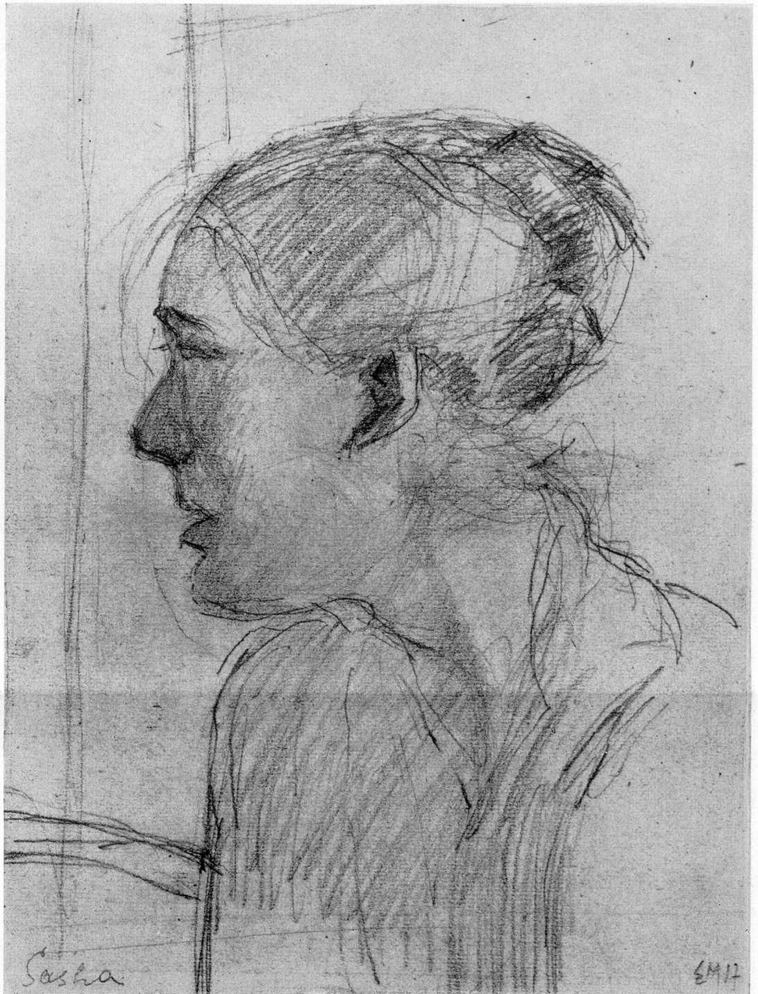
E. Morgenthaler: Sasha

des Menschen gesehen sind. Sie sprechen uns an, weil sie sozusagen an unserm Leben freundschaftlich offen teilnehmen.