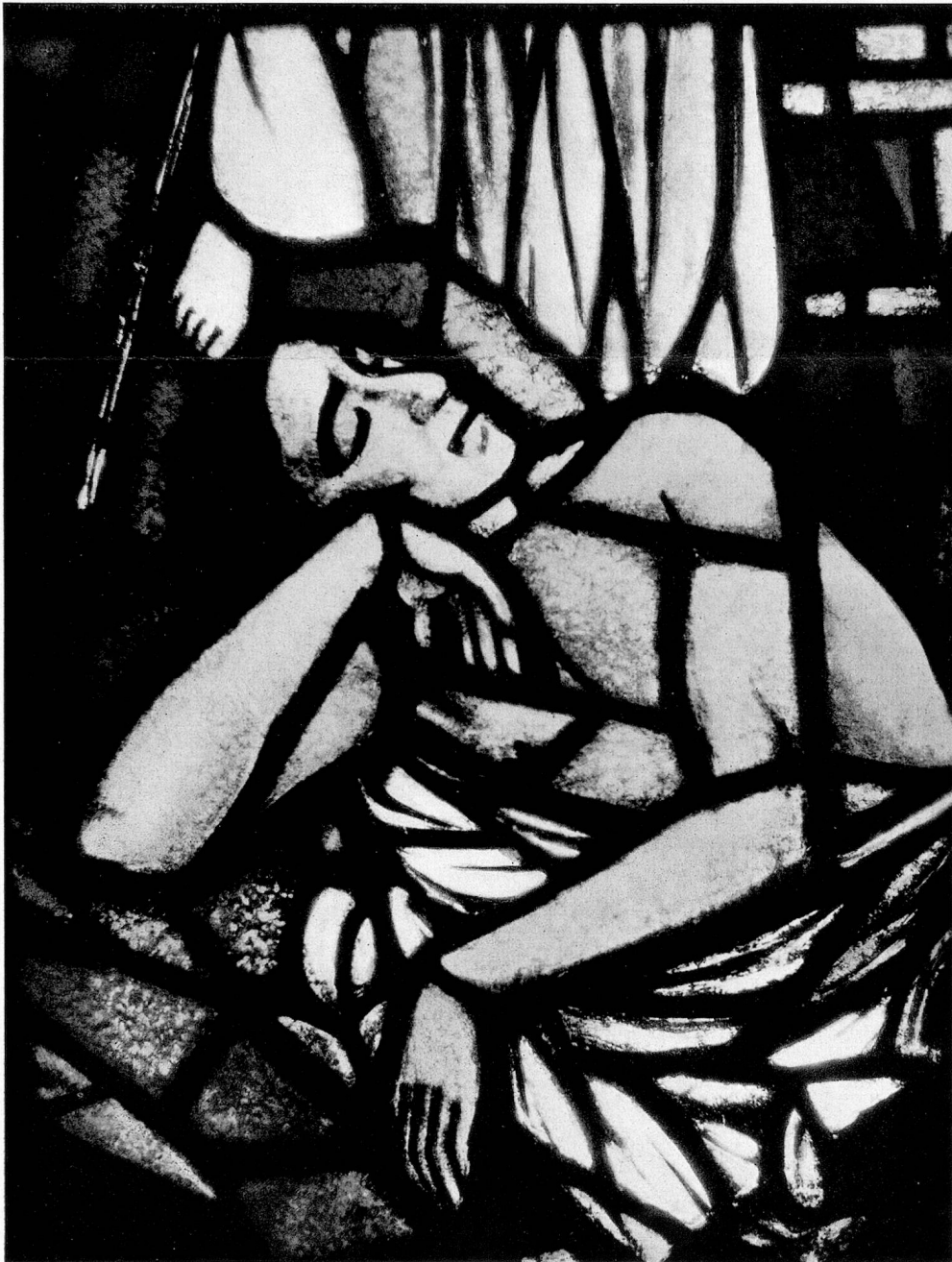
Carl Roesch: Jakobs Traum. 1927/28 Ausschnitt aus dem Glasgemälde in der Kirche Rüschtikon

Ein besonderes Verdienst Carl Roeschs ist aber auch die Wiedererweckung der alten Mosaikkunst, die er als erster bei uns zu neuem Ansehen gebracht hat. Es ist typisch, daß Roesch von allem Anfang an auf das ihm materialmäßig fremde Glas verzichtet hat und für sein Würfel- und Plattenmosaik Stein und bemalte und gebrannte Tonplatten wählte. An verschiedenen Orten entstanden Mosaiken, so vom eindrucklichen Würfelmosaik im Kunstgewerbemuseum Zürich bis zu den großen Wandkompositionen in der Eingangshalle des Wehrschulhauses Kreuzlingen, im Schulhaus Rütli sowie im Werk-schulgebäude der Georg-Fischer-Aktiengesellschaft Schaffhausen. Man spürt in diesen Werken immer den Künstler, der mit seinem Handwerk vertraut ist und stets Material und Komposition in Einklang bringt.