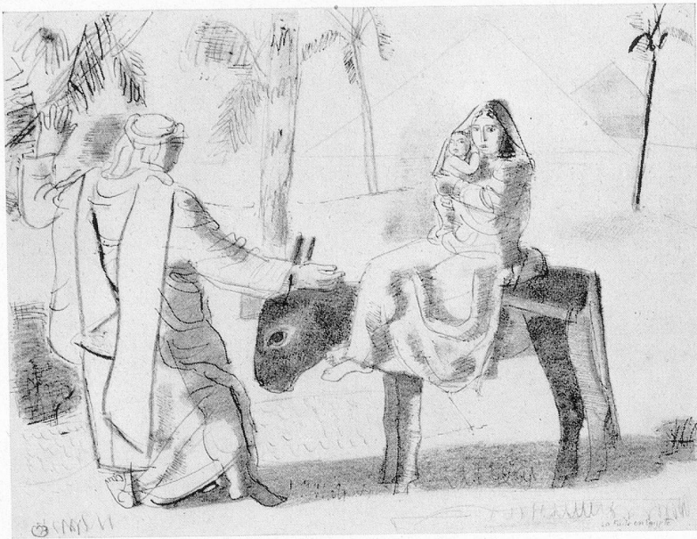
Maurice Barraud 1930