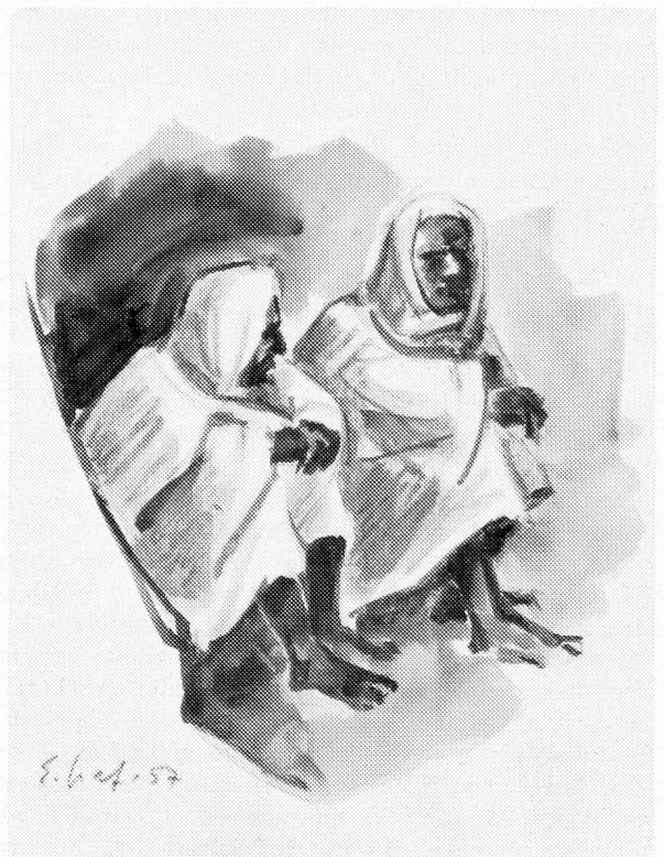
Eingeborene in Médénine

In Kairouan bekamen wir das erstmal das Nationalgericht, den arabischen «Couscous», bestehend aus Grieß, verschiedenen Gemüsen, Rind- und Lammfleisch. Dazu werden verschiedene Saucen serviert. An einer scharfen