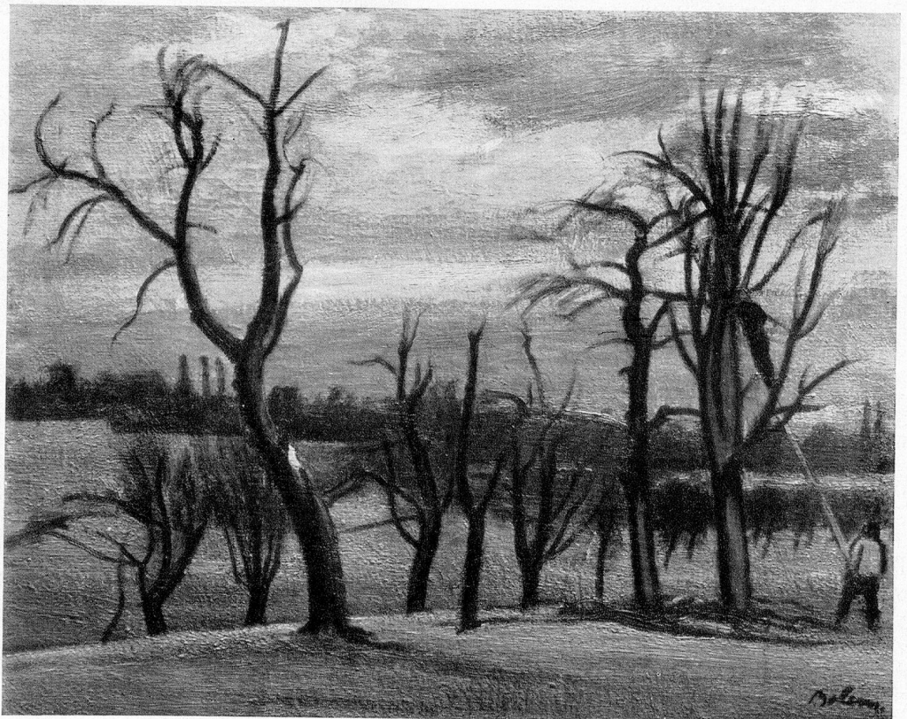
Ernest Bolens: Vorfrühling