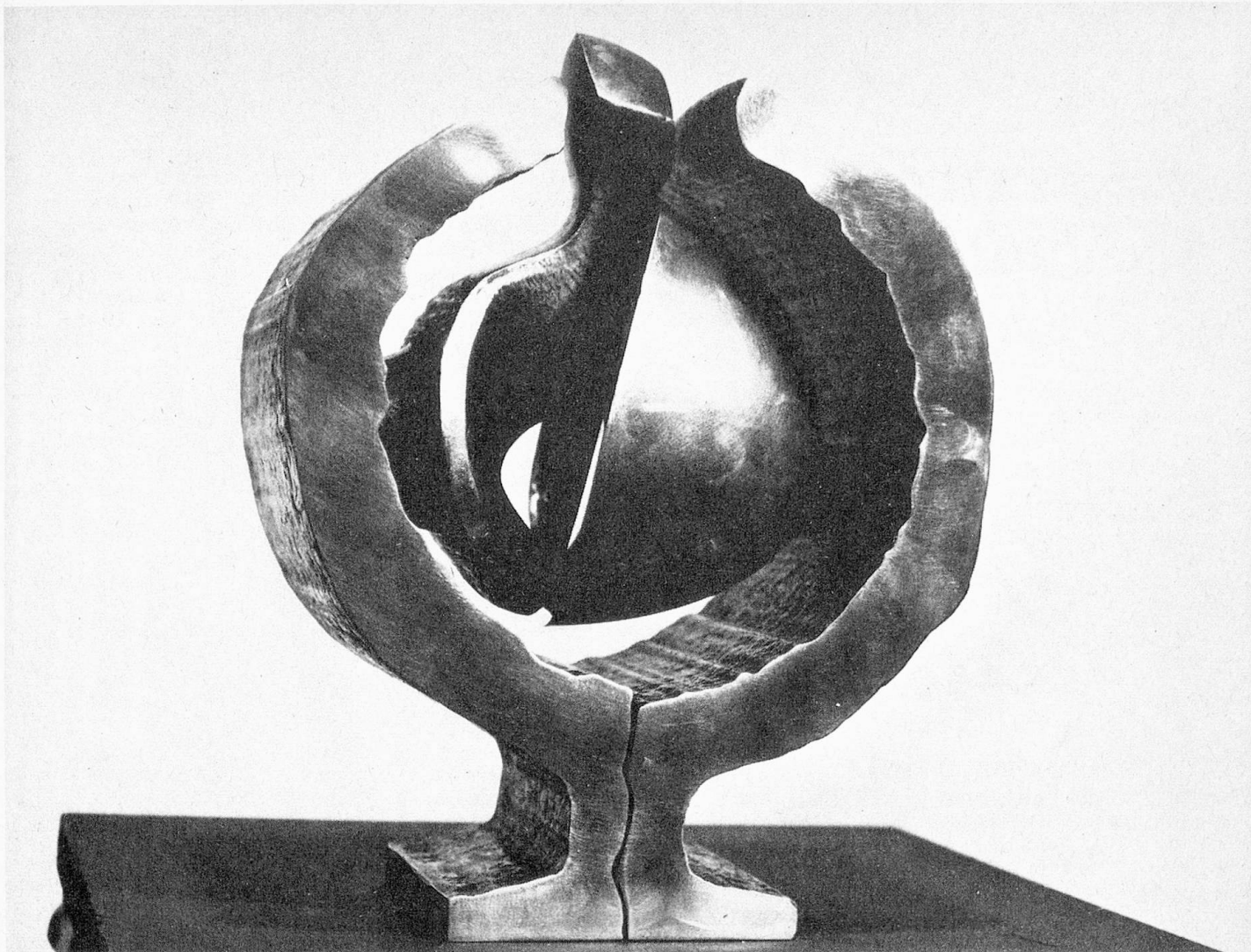
«Pour naviguer», bronze, 1972