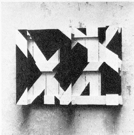
A. Hüppi: Pal 4, 1965