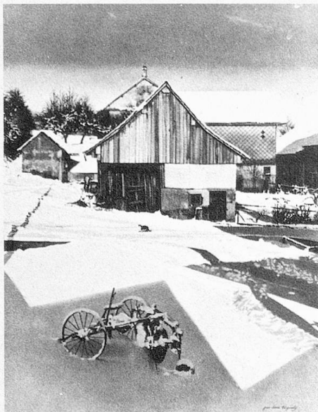
Jean-Louis Tinguely: Hiver à Prévondavaux (Bourse 1973)

vorgenommen: mindestens 4000 und höchstens 8000 Franken beträgt seither ein Stipendium; auf die längere Zeit noch ausgerichteten «Aufmunterungspreise» wird seither verzichtet. Aufgrund der geltenden Kunstverordnung darf jeweils höchstens ein Drittel des eidgenössischen Kunstcredits für die Ausrichtung von Stipendien verwendet werden. 1973 wurden 37 junge Künstler – die Altersgrenze beträgt 40 Jahre – mit einem Gesamtbetrag von 250 000 Franken unterstützt. In den letzten Jahren wird das Stipendium von den jeweils rund 350 Bewerbern aber nicht nur als eine notleidenden jungen Talenten zugedachte Hilfe aufgefasst. Vielmehr geht es heute, wo ja auch die meisten Kantone Ausbildungsbeiträge an Absolventen von Kunstakademien auszurichten pflegen und es andererseits ganz unmöglich ist, die finanzielle Situation im einzelnen abzuklären, manchen Teilnehmern darum, ihre Werke mit dem Schaffen ihrer Altersgenossen aus allen Teilen des Landes zu konfrontieren. Der Erhalt dieses begehrten Stipendiums dient natürlich auch der Stärkung des persönlichen Prestiges.