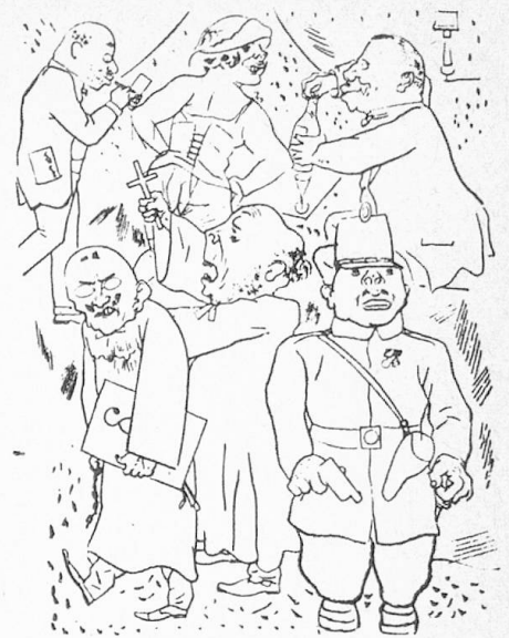
Völker Europas, wahrt eure heiligsten Güter.