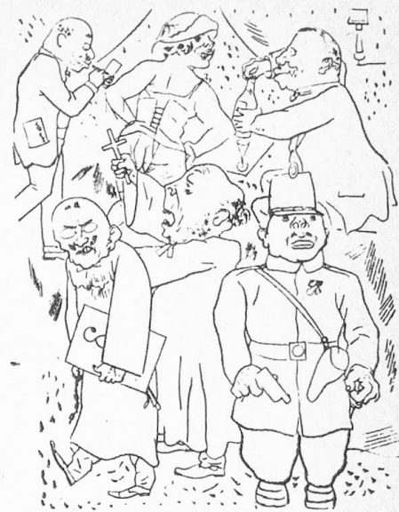
Völker Europas, wahrt eure heiligsten Güter.