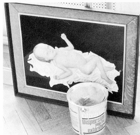
Kunst – ein hilfloses Kind? Bild aus dem Beitrag der Sektion Fribourg an der Biennale

Primum vivere, deinde philosophare, erst leben, dann philosophieren, heisst ein bekanntes Sprichwort. Auf Kunst und Kultur übertragen hiesse dies: erst das Leben, dann Kreativität. Darin aber liegt ein wesentliches Missverständnis von «Leben». Wird dieses nämlich auf die Biologie und Physiologie des menschlichen Leibes reduziert, oder auf die Erfüllung materieller Bedürfnisse, wird der volle Bedeutungsgehalt menschlichen Seins verpasst. Dieses nämlich findet seinen Sinn erst in der vollen Wahrnehmung und Antwortgebung allem Begegnenden gegenüber, in unserem Bezogensein auf die Fülle und Schönheit der Welt. Solches Wahrnehmen und Sehen ist ursprünglich gerade nicht verstandes- und vernunftmässiger, sondern wesentlich gemüthafter Natur. Nur wer für sein eigenes Gemüt offen ist, kann den Blick für das volle Menschsein öffnen. Nur er ist wirklich auf den Mitmenschen, auf die Welt der lebendigen Natur und der leblosen Dinge bezogen. Kunst ist somit immer Beziehung . Das künstlerische Werk ist Mitteilung eines Menschen, der mehr und anderes wahrnimmt als der in der Geschäftigkeit des Alltags aufgehende Mensch. Schöpferisch aber, so schrieb ein bedeutender Schriftsteller, kann innerhalb der alltäglichen Beziehung schon ein einfacher Mensch sein, der das Wort findet, das für den Nächsten wesentlich ist. Der Mensch dagegen, dem der Durchbruch zum Sein in irgend einem Bereich nicht gelang, kann als Dichter oder Künstler kaum Bedeutsames ausdrücken.