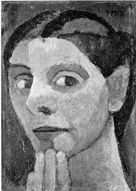
Selbstbildnis mit Hand am Kinn, 1906/07

Bei ihr sind denn auch jene Bilder am stärksten, bei denen sie für das, was sie selbst zu tiefst trifft, z. B. ein krankes Mädchen, ihr eigenes Selbstbildnis in Paris, im Atelier eine konzentrierte Form findet.»