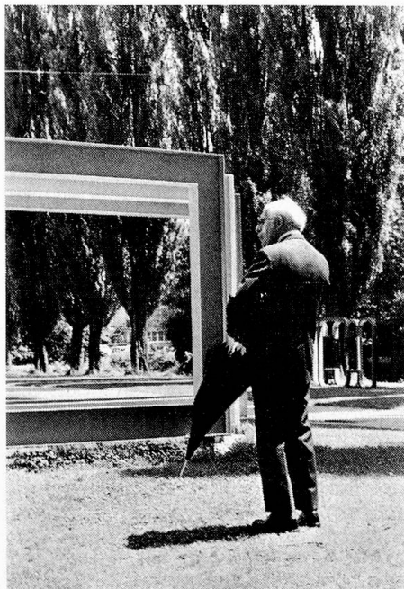
Der Kunst-Betrachter

Viele Postulate der Kommission zur Arbeitsbeschaffung für bildende Künstler sind in den letzten Jahren in erfreulicher Weise verwirklicht worden. Andere harren der Erledigung, wie zum Beispiel die gesetzliche Regelung der Vorschrift, wonach ein bis zwei Prozent der Bausumme, in den Baukredit hineingenommen, der künstlerischen Ausschmückung vorbehalten bleiben sollen oder etwa der Bau von Atelierhäusern u. a. Die Lösung hängiger Fragen kann herbeigeführt werden, wenn die Künstler die in ihrem Interesse stehende Tätigkeit der Kommission mit Sympathie verfolgen und bei Einzelaktionen auch unterstützen.»