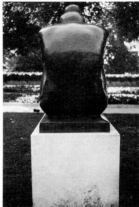
Aristide Maillol: La nuit