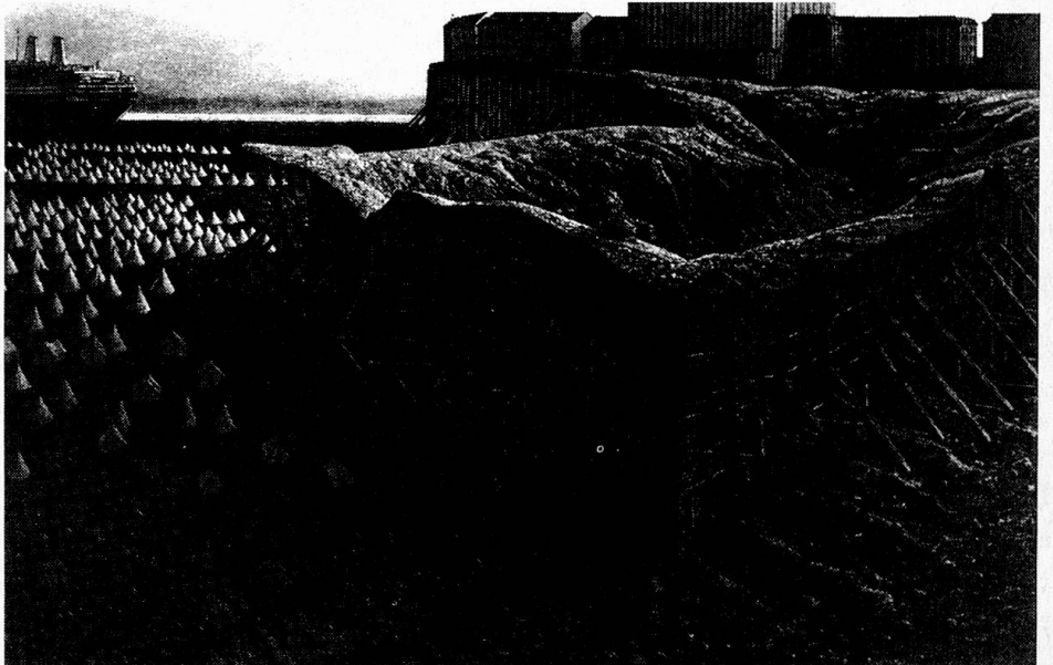
Radierungen aus dem Zyklus «Hafen- stadt», 1980