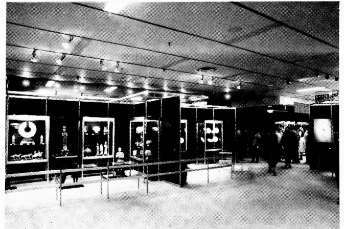
Vue générale de l'exposition à la Placette

D'emblée, il faut remarquer le professionnalisme avec lequel de telles expositions sont réalisées; car c'est un personnel qualifié qu'on engage (parfois à plein temps), spécifiquement pour l'organisation et la mise en place de celles-ci. En outre, de cas en cas, on fait généralement appel aux plus grands spécialistes du thème choisi, conservateurs de musée et historiens de l'art, pour qu'ils sélectionnent les oeuvres, rédigent le catalogue et dirigent l'installation. Les catalogues, souvent luxueux mais sobres, sont de grande qualité, autant par le texte que par les reproductions, et sont tirés à des milliers d'exemplaires. Une attention toute nipponne est portée à la présentation des oeuvres, ambiance du lieu, couleurs, éclairage, "respiration" des objets ou des tableaux. On n'hésite pas, par exemple, à fabriquer des meubles et des présentoirs sur mesure, comme ce fut le cas dans chacun des trois magasins de la chaîne Mitsukoshi