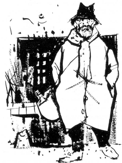
Illustration de l'ouvrage «Du haut de ma potence», Edition du Jura Libre, 1961.