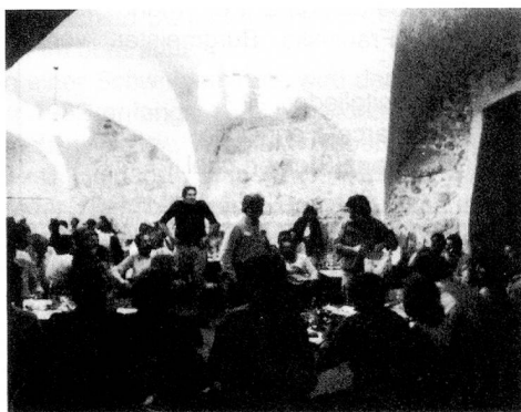
Les délégués au Foyer du théâtre.