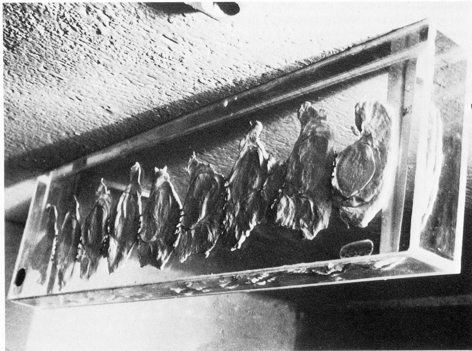
Studium, 1980 Glas, Fleisch, Formalin, 100×30×10 cm