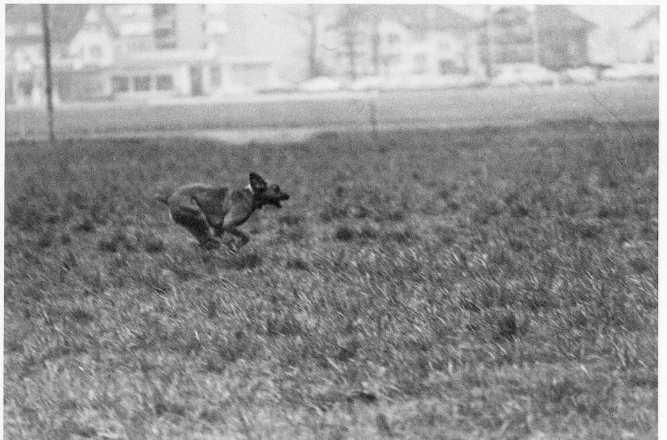
Diesel, 1976 Fotografie 19,8x29,2 cm

Mi spiacerebbe se per motivi di pura comodità da parte degli studenti dovessero andar perse occasioni di studio in scuole all'estero.