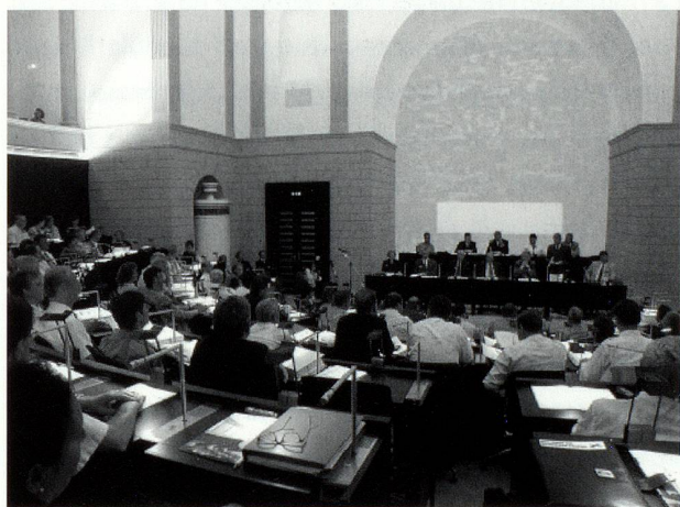
Reuss, Grossratssaal, Luzern, 2001, Renée Levi, Architekt: Marcel Ferrie

pace construit. Il n'est donc pas surprenant que les moyens et la procédure soient les mêmes dans une large mesure: la couleur distribuée par atomiseur, renonciation à la toile, murs, parois et surfaces comme supports. Le langage visuel est présymbolique, pictural-ornemental, un instrument avec lequel l'artiste explore les possibilités actuelles de la peinture. Elle l'utilise pour réagir à la situation donnée, s'y inscrit et la transforme en un lieu d'expérience sensorielle.