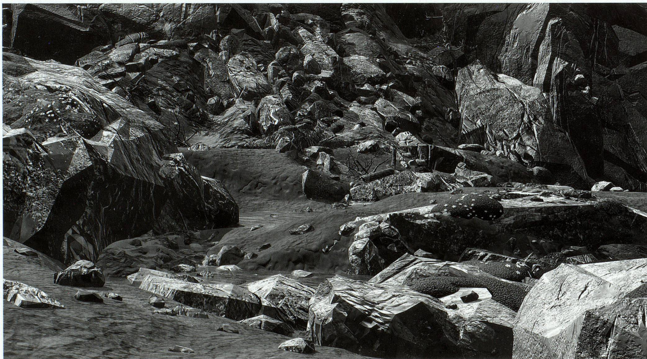
«Geröll», Monica Studer/Christoph van den Berg, 2005 grossformatiger Inkjet-Print/Fotopapier/Alu H 220 cm x B 405 cm (dreiteilig), Kunstmuseum Solothurn

Ist eine temporäre Verlagerung der künstlerischen Tätigkeit ins Ausland notwendig für Schweizer Kunstschaffende? Viele beurteilen die gesammelten Erfahrungen ihrer Auslandjahre als Gewinn für ihre künstlerische Entwicklung, und ein Stipendium für ein Werkjahr im Ausland stärkt nicht zuletzt das Selbstbewusstsein, kommt es doch einer Auszeichnung gleich und ist nicht selten an eine renommierte Institution geknüpft.