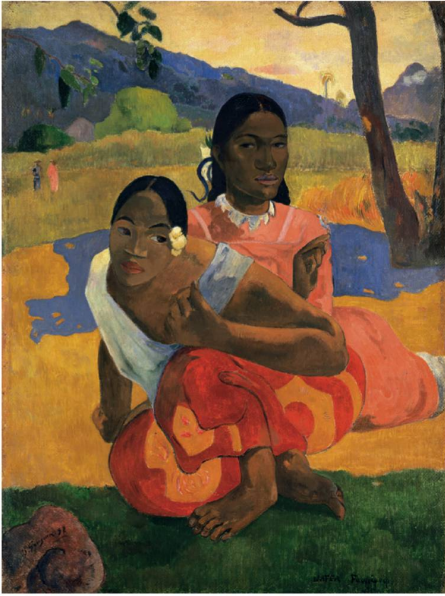
Paul Gauguin, Nafea faa ipoipo, Quand te maries-tu? Wann heiratest Du? , 1892, Öl auf Leinwand, 105 × 77.5 cm, Privatsammlung

plattform für die Kunst seit der Moderne etabliert worden, die von Anfang an viel weltoffener war als etwa der Kölner Kunstmarkt, die spätere Art Cologne, die ihr Profil stark im Hinblick auf die deutsche Händlerszene gewann. Gleichwohl hat sich die Art Basel über viele Jahrzehnte auch als ein Schaufenster für Schweizer Galeristen und die von ihnen vertretenen Künstler verstanden. Es gab keine Prozentzahlen, aber einen Heimbonus, der stillschweigend gewährt wurde. Damit war spätestens dann endgültig Schluss (sieht man von ein paar Basler Galerien ab), als die Messe nach Miami Beach in Florida 2002 im Jahr 2013 in Hongkong ihre dritte Destination eröffnete. Ziel war es, die führende Kunstmesse in einer globalisierten Handelswelt zu sein und möglichst viele der international führenden Galerien zu versammeln. Dass dabei eine kleine Galerie nach der anderen aus der Teilnehmerliste fiel, war lediglich eine Folge der neuen Orientierung. Anspruch auf globale Leadership und regionale Rücksicht gehen schlecht zusammen, auch wenn die Qualität durchaus den gewünschten Kriterien entspricht. Das betrifft notabene nicht nur die Art Basel, sondern auch andere führende Kunstmesen wie die Frieze London oder die TEFAF in Maastricht. Wo immer mehr Händler aus aller Welt ihre Künstler präsentieren wollen, wird der verfügbare Raum immer enger.