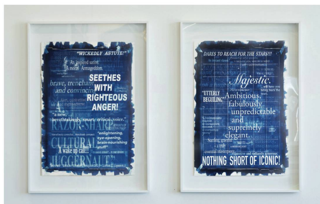
Colin Guillemet, The blueprint (anger) , 2016, Cyanotype on paper on plywood, 115 × 80 cm; The blueprint (majestic) , 2016, Cyanotype on paper on plywood, 115 × 80 cm; sold March 2017