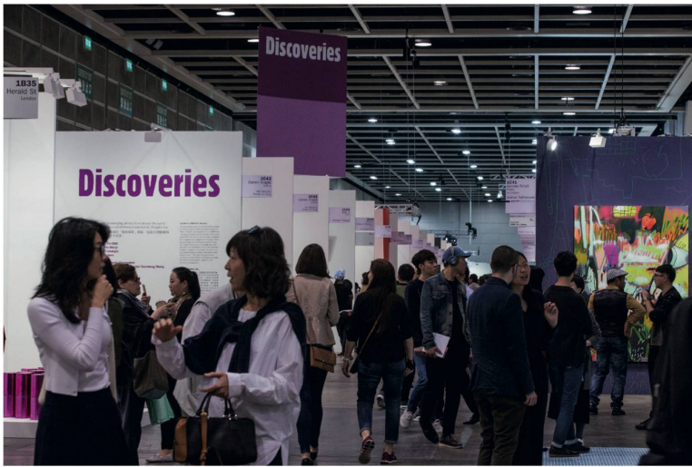
Art Basel Hongkong 2017