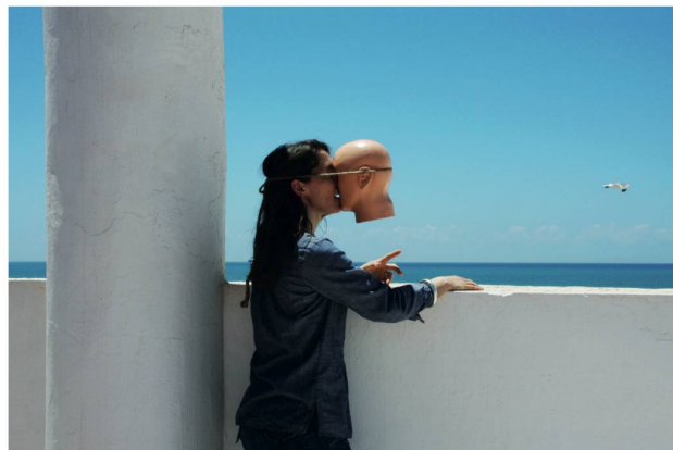
Clarina Bezzola, Nicht bei der Sache_Meersicht , 2008, 33 × 45.7 cm, aus der Serie: Nicht bei der Sache (Werkgruppe Lärm im Kopf) , Kollaboration mit Ji Lee, Edition: 1/5 + 2AP; verkauft November 2017