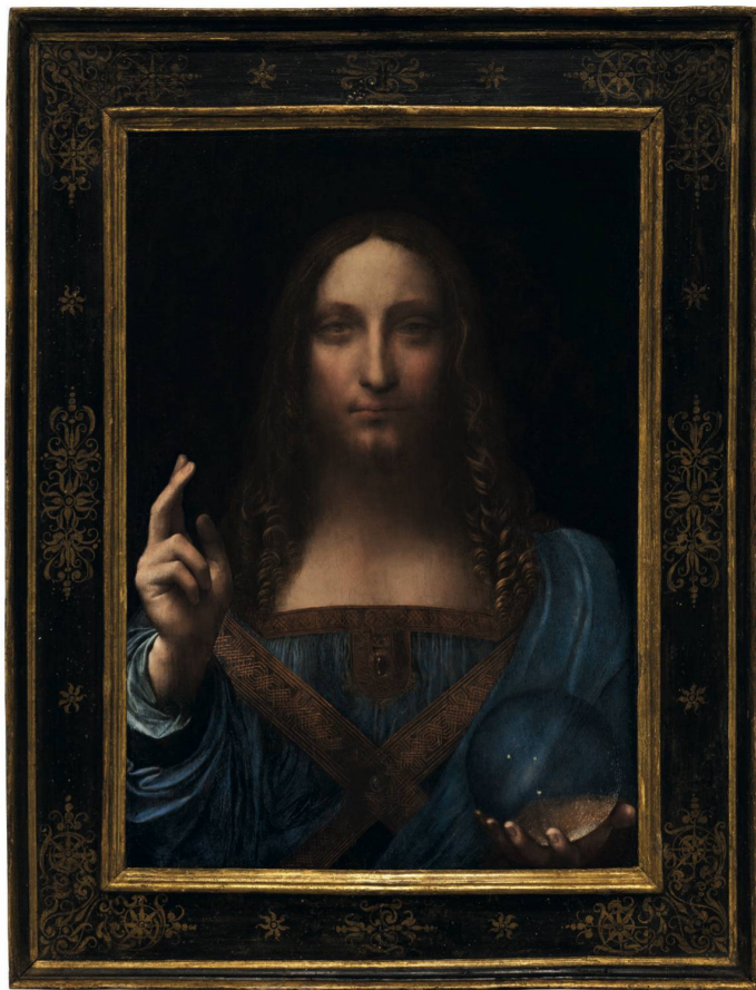
Leonardo da Vinci, Salvator Mundi , um 1500, Öl auf Walnussholz, 65.7 × 45.7 cm, Louvre Abu Dhabi