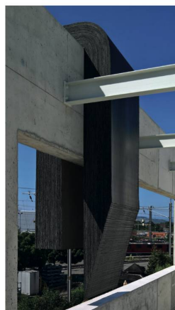
Kilian Rüthemann, The Sound of Many Voices (in the Street Commanding Silence) , 2017, Bitumen-Schweissbahnen, 280 × 100 × 84 cm; verkauft 2017