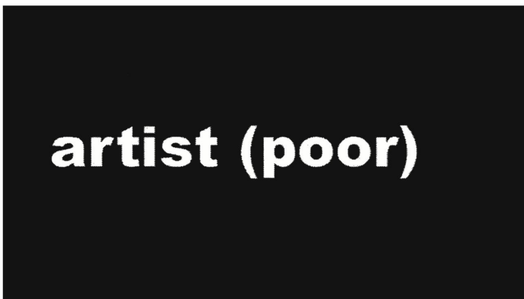
Alex Meszmer, Ohne Titel , Digitalprint, 2019, ©2019, ProLitteris, Zürich