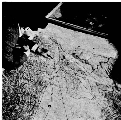
Ing. Meyer an der Verkehrskontrollkarte. Die Positionen der Zürich anfliegenden Flugzeuge sind durch Pappmodelle festgehalten, so dass der Verkehrskontrolleur einen genauen Ueberblick über die Dübendorf berührenden Maschinen hat.

Kollisionsgefahr mit andern Maschinen auszuschliessen. Die in der Luft befindlichen Verkehrsflugzeuge pflegen sich gegenseitig durch ihre Funkstation miteinander über die Route und Flughöhe zu verständigen, doch fehlt ihnen naturgemäss die genaue Uebersicht, wie sie der Verkehrskontrolleur am Boden auf der Verkehrskontrollkarte besitzt. Er wird ihnen also auf funktelegrafischem Wege Weisungen erteilen über einzuhaltende Flughöhe und Geschwindigkeit etc.