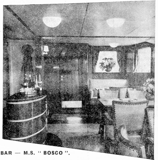
BAR — M.S. "BOSCO".

Der Kapitän setzt eine grüne Flagge bei (Zollflagge für Transitgüter) und vorwärts geht's, in den Abend hinein, Holland mit seinen Windmühlen hinter uns lassend.