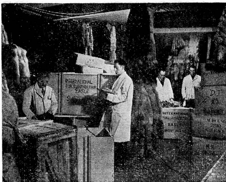
Our expert Staff pack and ship valuable Furs to all parts of the World

Official Passenger Agents for all Principal Steamship Companies - Official Freight & Passenger Agents for all Air Lines.