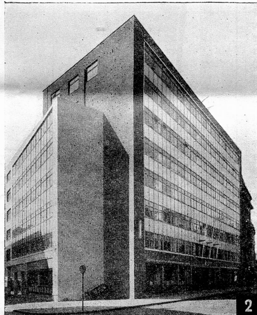
Fig. 2 BRITISH INDIAN STEAM NAVIGATION CO. LTD. Navigation House, London, E.1. Architect Theo. H. Birks, F.R.I.B.A.