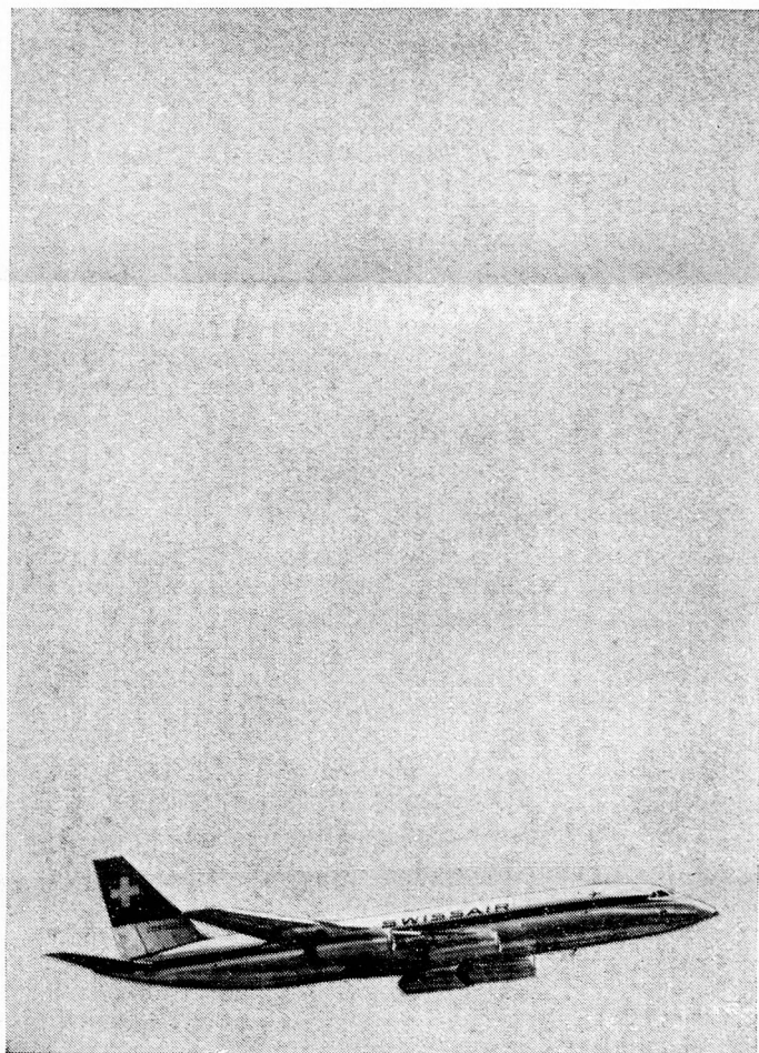
*IN ASSOCIATION WITH B.E.A.

THROUGHOUT THE WORLD ARE SERVED BY BIG, FAST SWISSAIR JETS INCLUDING THE CORONADO—THE WORLD'S MOST ADVANCED PASSENGER JET. DAILY CARAVELLE FLIGHTS FROM *LONDON TO ZURICH AND GENEVA CONNECT WITH SWISSAIR'S WORLD-WIDE JET NETWORK. SWISSAIR SERVICE IS LEGENDARY—PROVE IT FOR YOURSELF NEXT TIME YOU GO ABROAD.