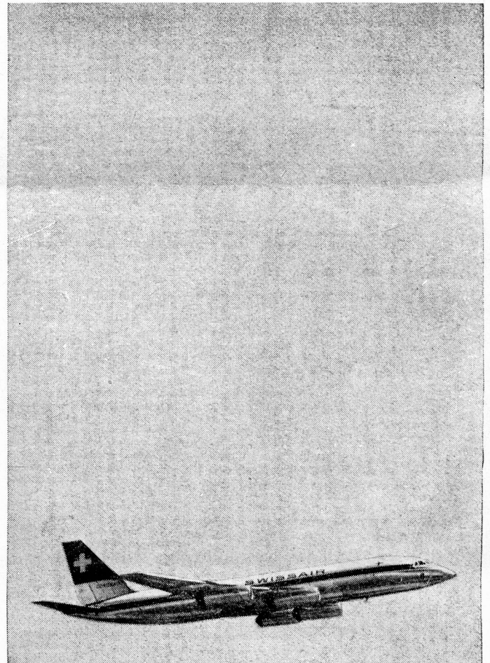
*IN ASSOCIATION WITH B.E.A.

THROUGHOUT THE WORLD ARE SERVED BY BIG, FAST SWISSAIR JETS INCLUDING THE CORONADO—THE WORLD'S MOST ADVANCED PASSENGER JET. DAILY CARAVELLE FLIGHTS FROM *LONDON TO ZURICH AND GENEVA CONNECT WITH SWISSAIR'S WORLD-WIDE JET NETWORK. SWISSAIR SERVICE IS LEGENDARY—PROVE IT FOR YOURSELF NEXT TIME YOU GO ABROAD.