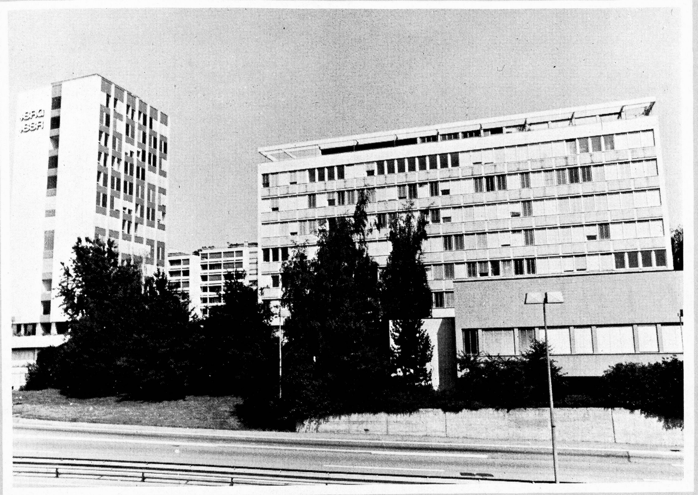
The European and Overseas Services of the Swiss Broadcasting Corporation since 1935