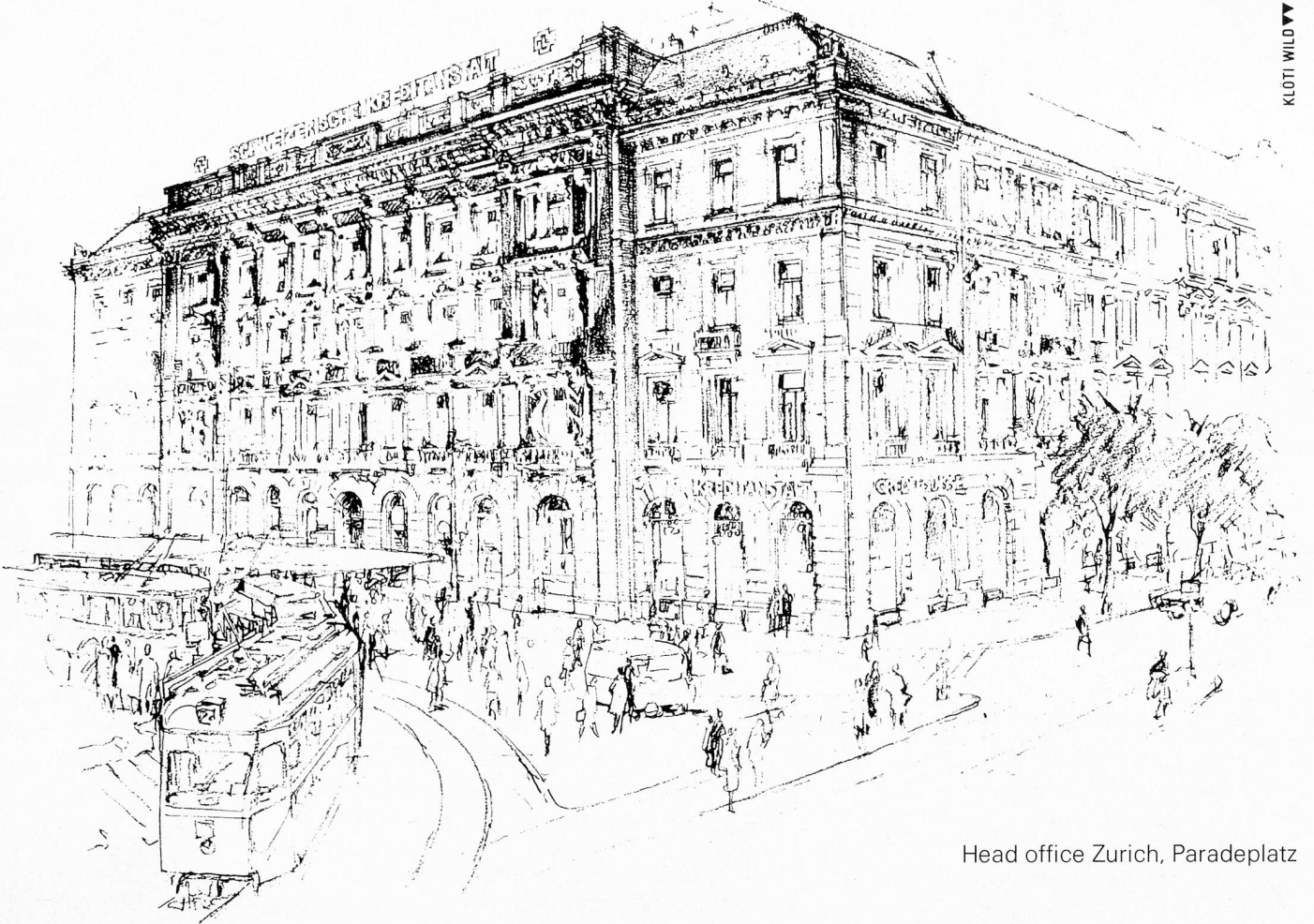
Head office Zurich, Paradeplatz

Successful people bank with Credit Suisse. Worldwide. Since 1856.