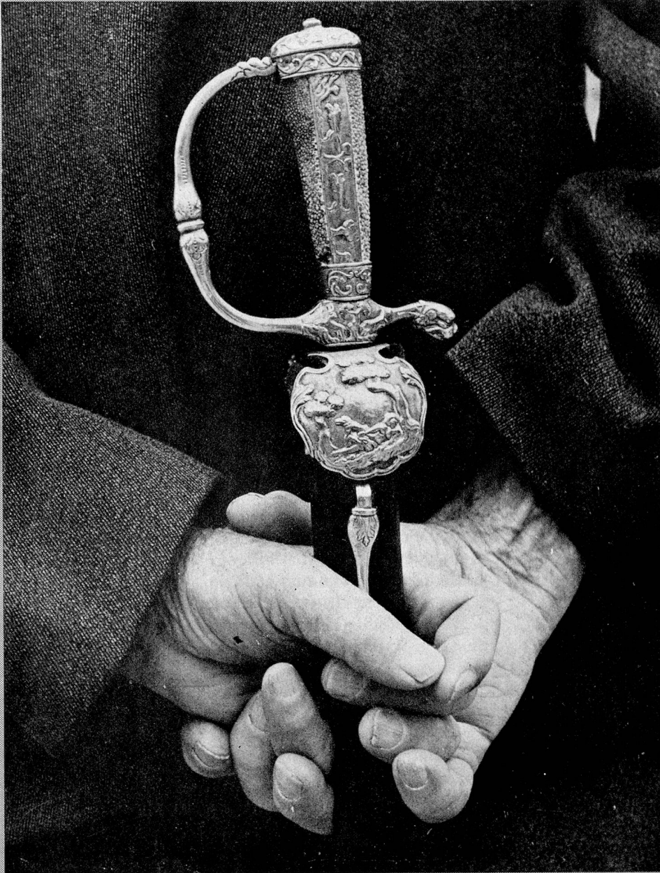
In the canton of Appenzell, the sword symbolizes the citizen's right to vote

THIS ISSUE CONTAINS OFFICIAL INFORMATION.