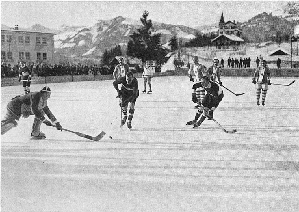
Eishockey in Gstaad / Hockey sur glace à Gstaad