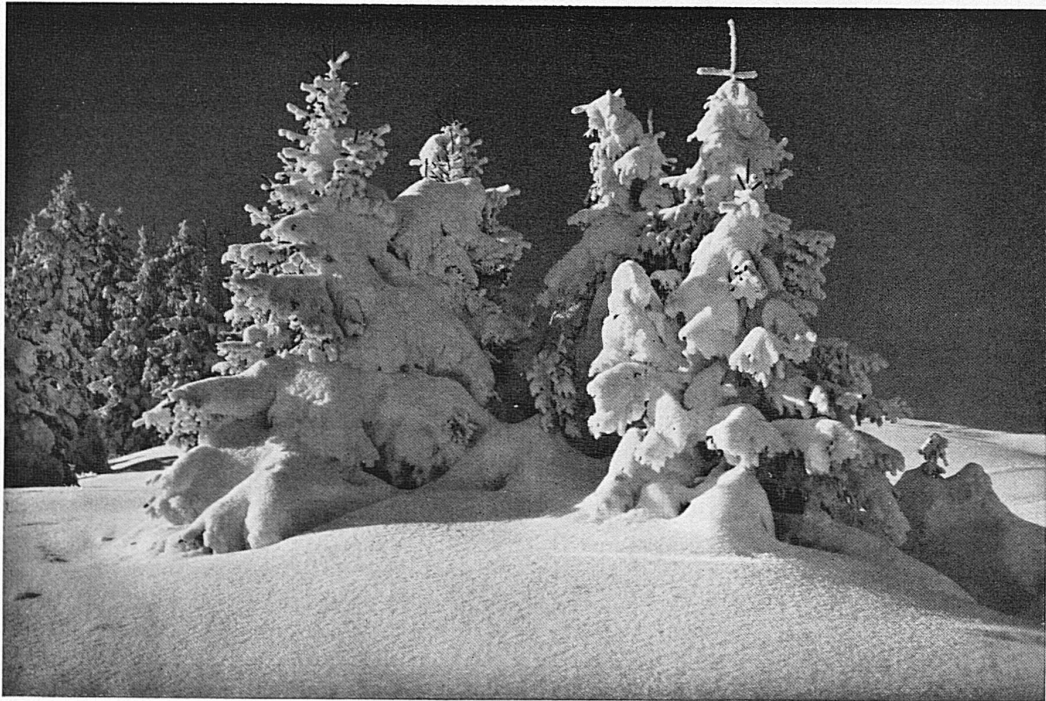
Schneetannen bei Adelboden / Sapins sous la neige à Adelboden