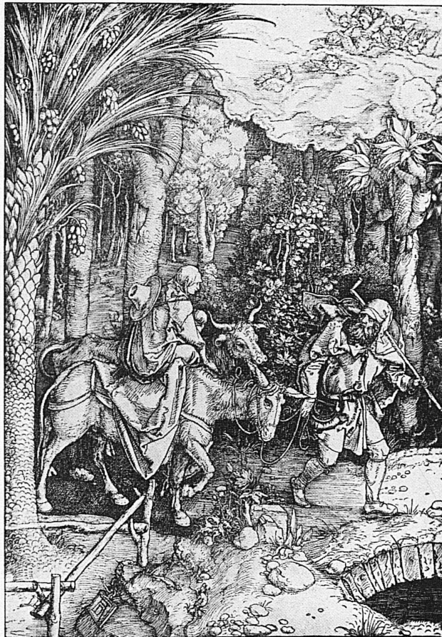
La fuite en Egypte / Die Flucht nach Aegypten D'après Dürer vers 1510 / Nach Dürer um 1510

« De ce côté-ci », pense Hansi, « c'est très joli, mais c'est pour les enfants riches. Il faudrait beaucoup d'argent pour entrer dans ces magasins où il y a tant de belles choses. Et puis, ça ne doit pas être amusant de circuler dans ces rues. » En effet, les automobiles, les bicyclettes, les voitures de tout genre s'y pressent serrés comme les grains d'une grappe de raisin. A chaque