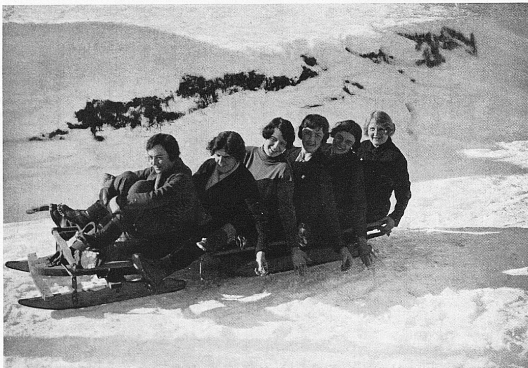
Fröhliche Fahrt / Joyeuse partie