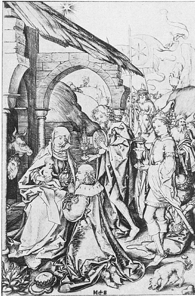
L'adoration des Mages / Die Anbetung der drei Könige D'après Schongauer vers 1480 / Nach Schongauer um 1480

de noix, de fils brillants et d'étoiles en sucreries. Au pied de l'arbre, un tout petit Jésus de cire tend les bras sur un peu de paille. « Cette année il faut que tout soit plus joli, puisque notre Hansi est guéri », dit le père. Ah! que le sapin sent bon; il semble que toute la forêt est entrée avec lui dans la maison. Voilà qu'on allume les bougies ... la chambre resplendit comme une chapelle, tant il y a de lumières! « Prions d'abord », dit la mère. Et tous ensemble prient devant la modeste crèche qui a déjà vu bien des Noëls ... puis c'est le cantique que l'on chante autour de l'arbre et que le cri-cri du grillon, sous la pierre du poêle, accompagne de sa note aiguë. Ensuite Hansi reçoit ses cadeaux. Que de choses pour lui: un beau couteau, une écharpe à raies rouges, un livre plein d'histoires, du pain d'épices, et sa sœur lui a fait une surprise: des mitaines tricotées en cachette et des sucres d'orge. Comme tout le monde a l'air content! Comme ses parents l'embrassent! On partage encore