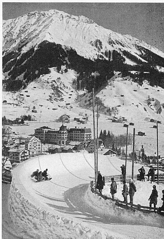
Die Bobbahn in Klosters / La piste de bobsleigh à Klosters