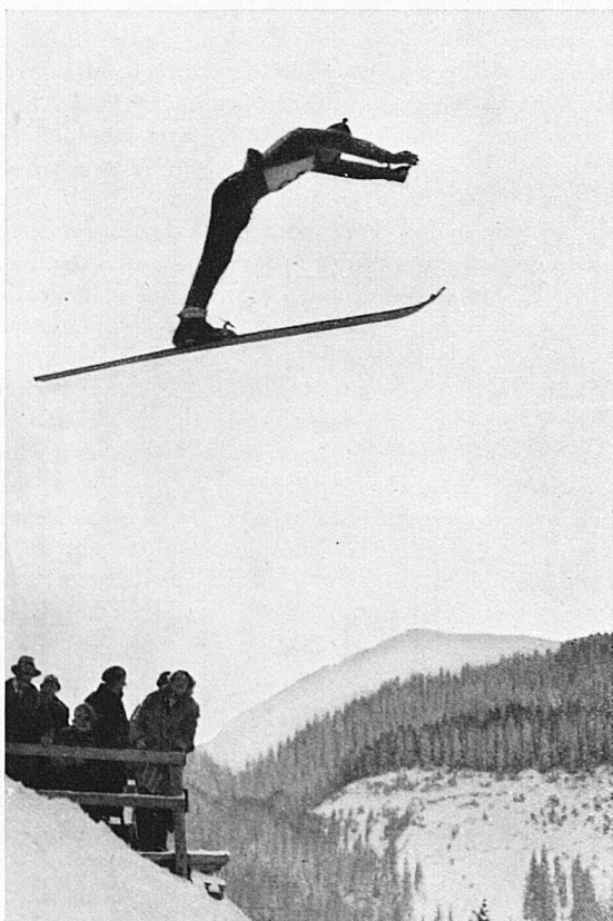
Ein stilvoller Sprung von der Selfrangaschanze in Klosters