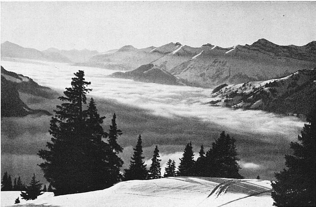
Blick vom Hornberg ins Pays d'Enhaut / Panorama du Pays d'Enhaut vu du Hornberg