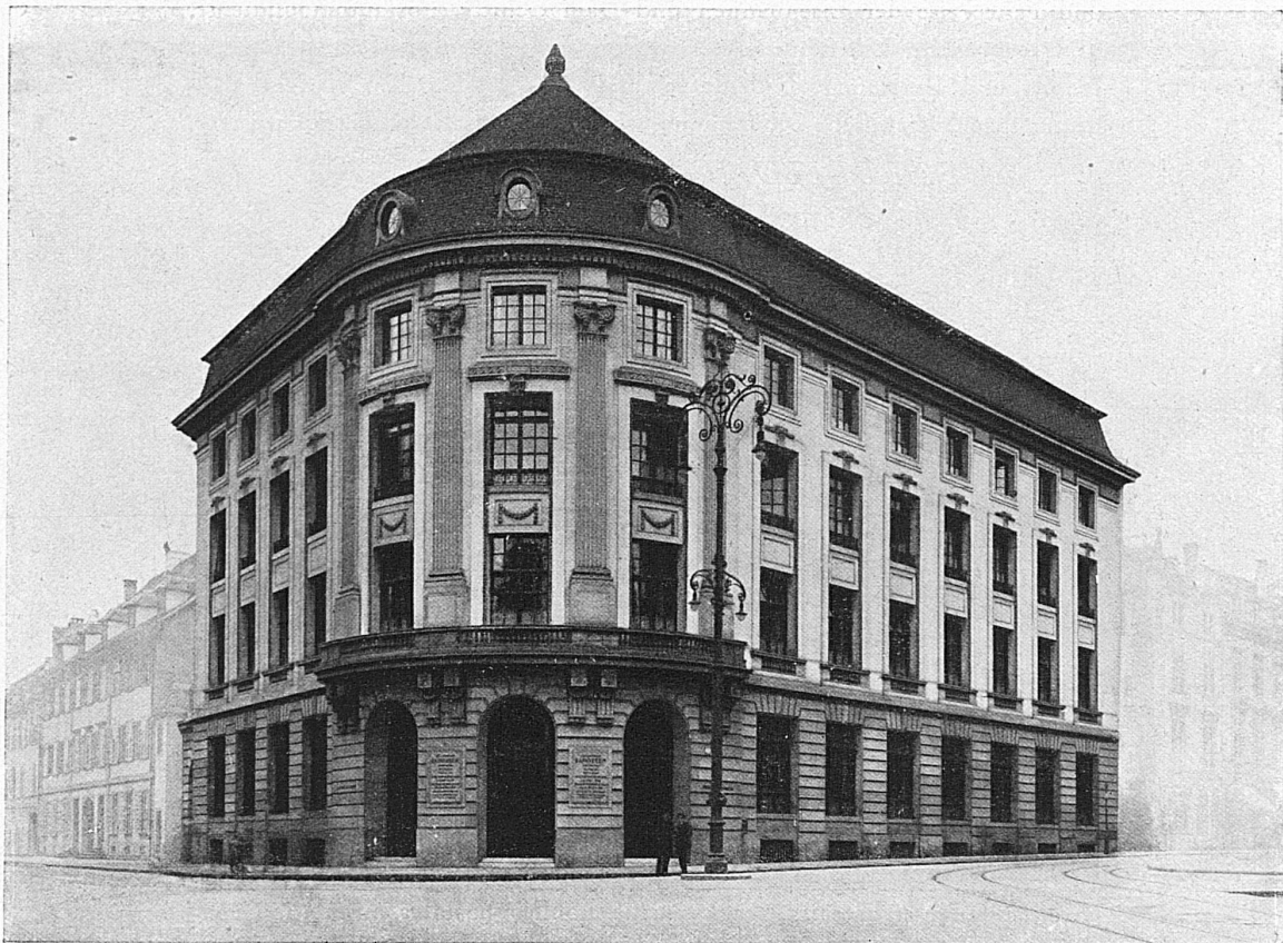
Gesellschaftssitz Basel — Siège social à Bâle

Biel - Chiasso - Herisau - Le Locle - Nyon - Aigle Bischofszell - Morges - Les Ponts - Rorschach