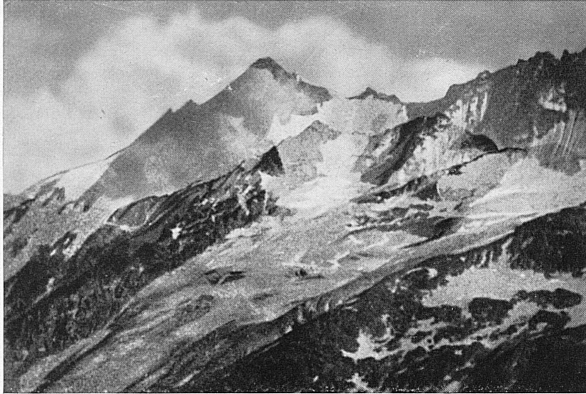
Am Simplon / Une partie du Simplon

gangenheit als Namen, der von den Gestaden des blauen Genfersees nach Aosta und Turin hinüberführt. Die Strecke Orsières (im Wallis) bis Aosta wird vom Automobil bedient.