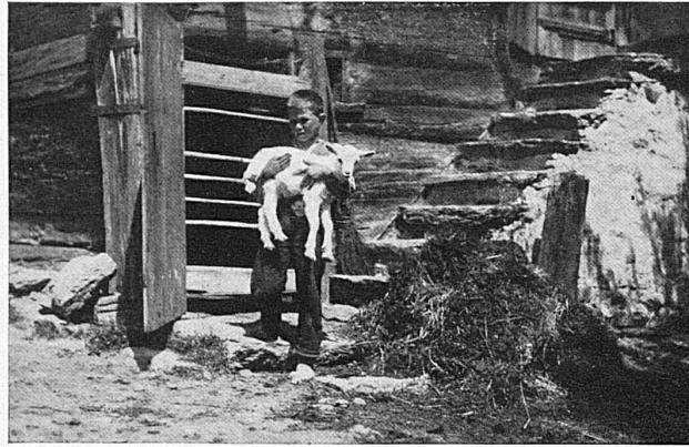
Ein Gomserbub / Un jeune chévrier

Einem besinnlichen Wanderer wird auch die Lukmanierstrasse (von Disentis nach Acquarossa) oder die Bernhardinstrasse (von Thusis nach Mesocco) nicht zu lange erscheinen. Und wenn gar die «Wanderung» mit Hilfe des komfortablen