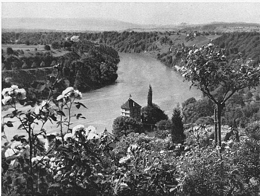
Schaffhauser Rheinlandschaft / Rives du Rhin dans le canton de Schaffhouse