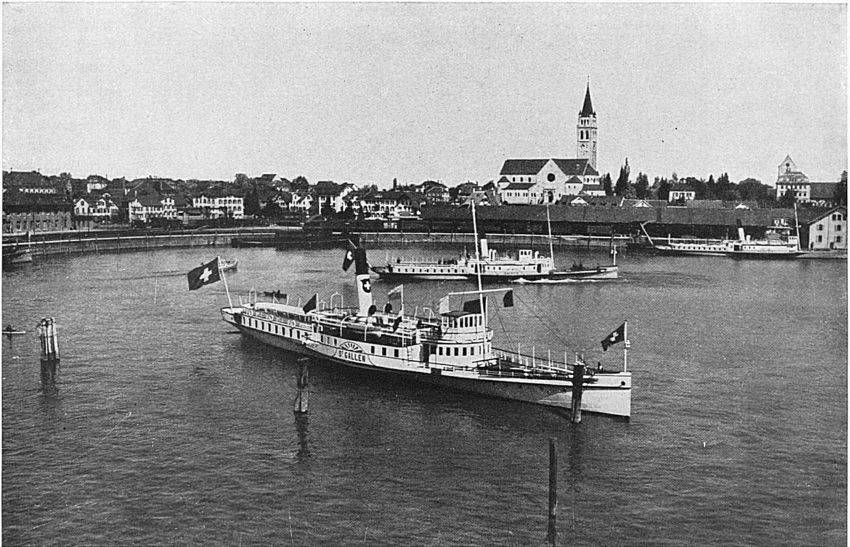
SBB-Dampfer im Hafen von Romanshorn / Bateau à vapeur des CFF dans le port de Romanshorn