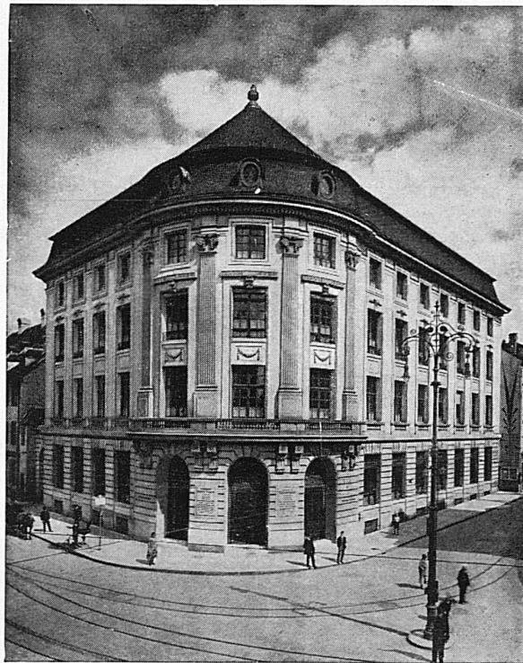
Gesellschaftssitz Basel — Siège social à Bâle