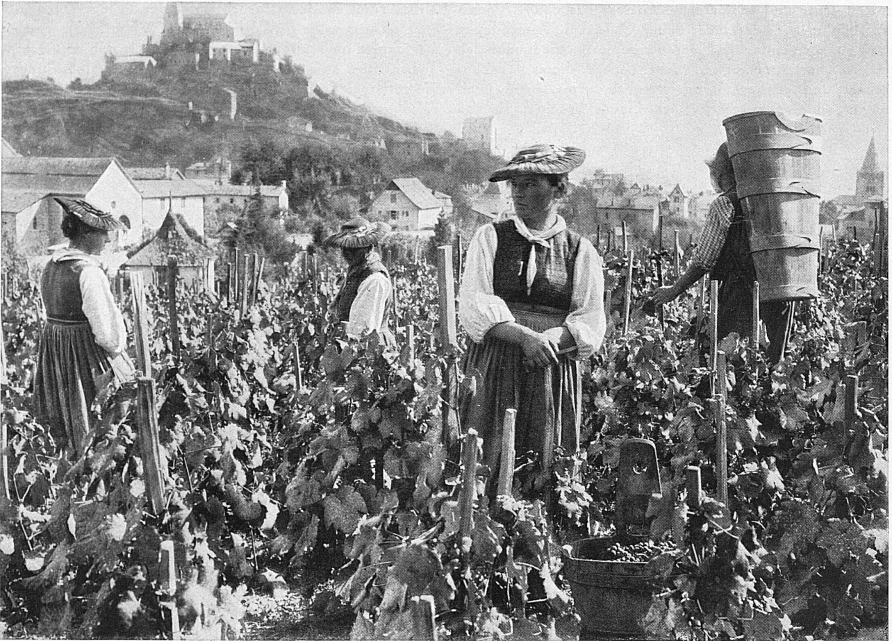
Weinlese in Sitten / Les vendanges à Sion