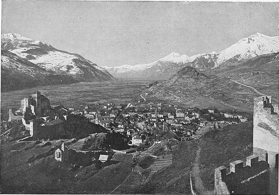
Sion / Sitten