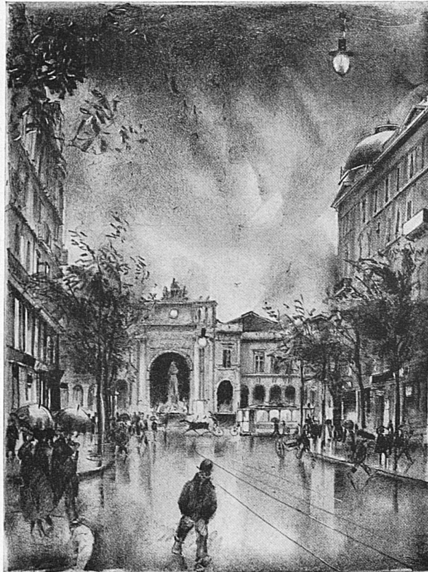
Blick von der Bahnhofstrasse zum Bahnhof Nach einer Lithographie von O. Baumberger

Gewiss, wir leben rascher in Zürich als anderswo. Der Strom der Welt reisst uns mit. Und wir lassen uns reissen. Unklug wär's, wir stemmten uns mit Gewalt gegen den Ansturm der Zeit. Denn wir haben nun einmal an die grosse Völkerstrasse gebaut, und jetzt flutet das Leben in Expresszügen von Norden und Süden daher, von Osten und Westen, und gerne verweilt's für kürzer und länger unter uns und geniesst das Treiben der heranwachsenden Großstadt.