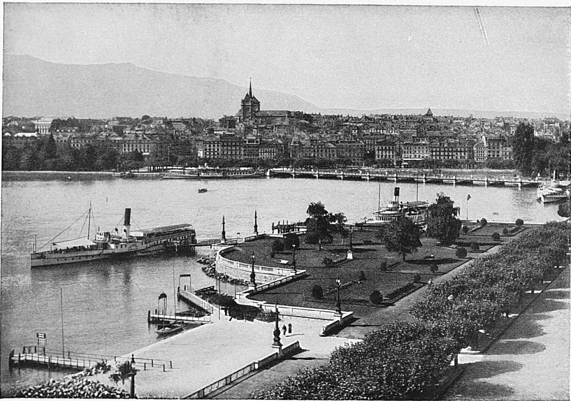
Genève / Genève