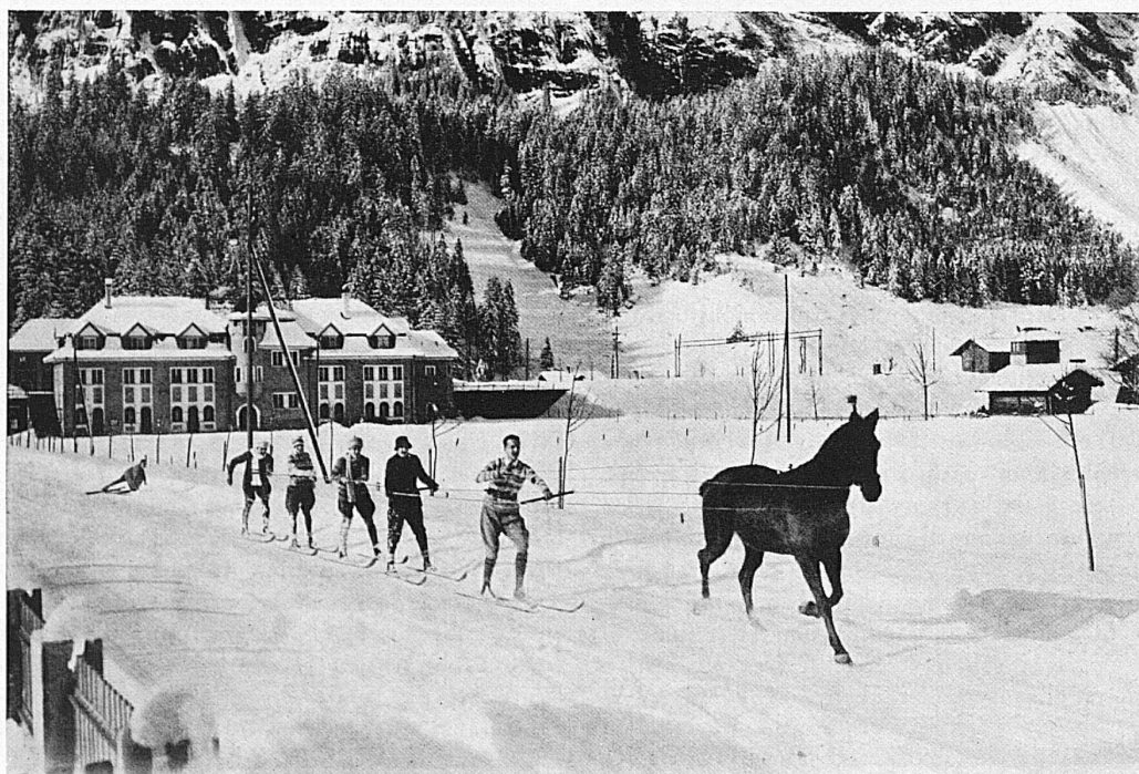
Skijöring in Kandersteg / Skijöring à Kandersteg