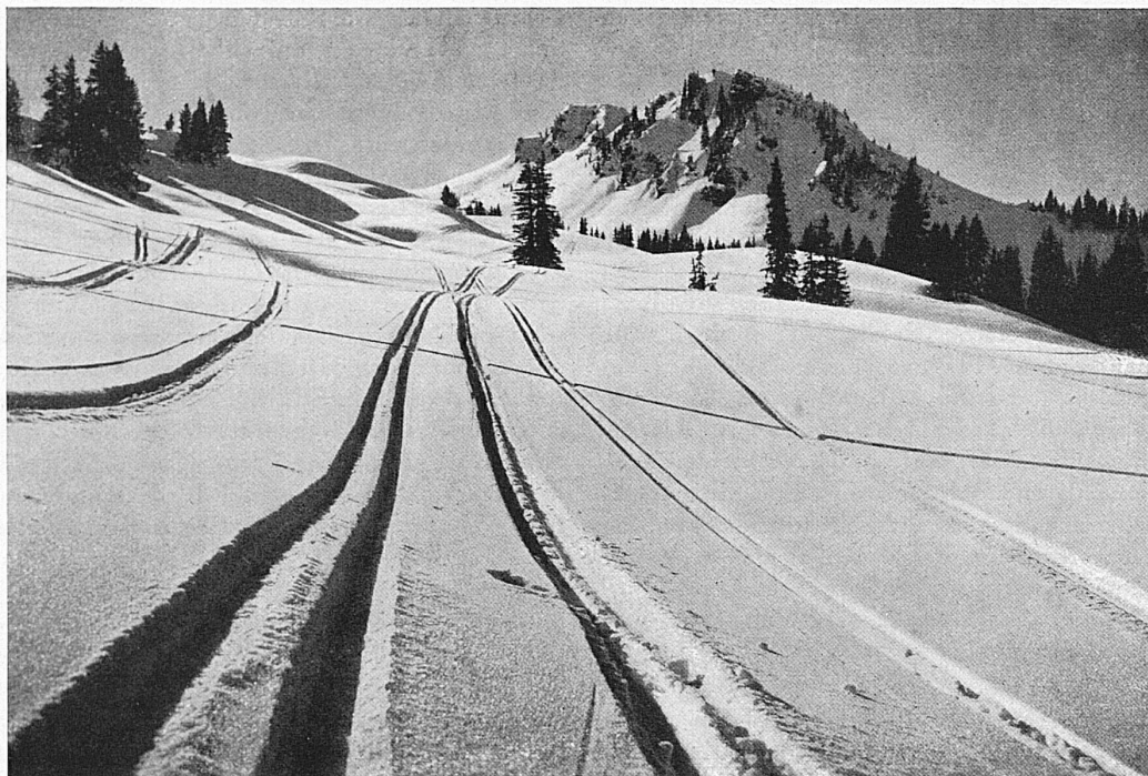
Skigelände bei Gstaad / Piste de ski près de Gstaad