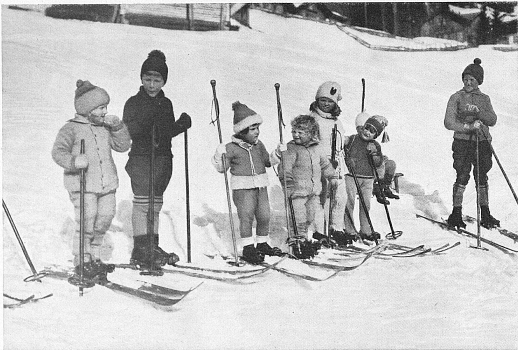
Skirekruten / Les recrues du ski