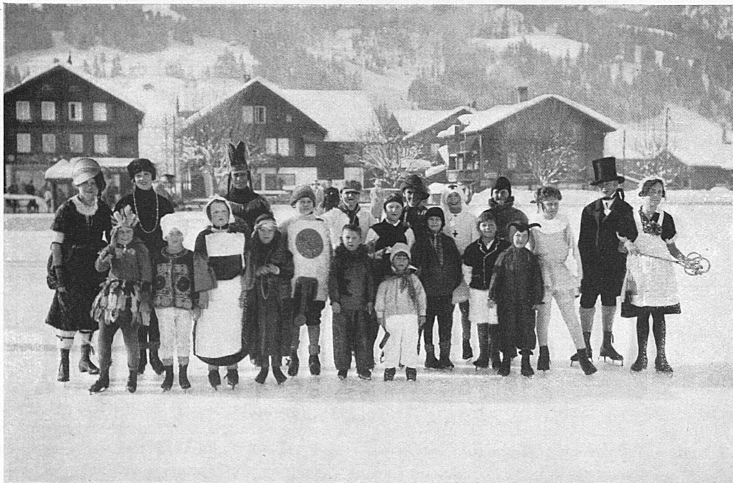
Eiskarneval / Carnaval à patin