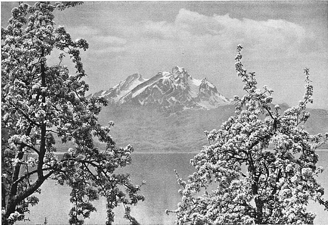
Frühling am Vierwaldstättersee Le printemps aux bords du lac des Quatre-Cantons